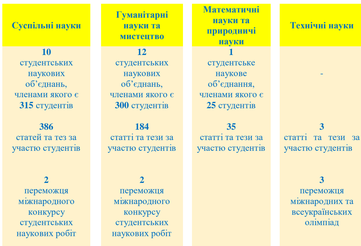
Рис. 11. Розвиток студентської науки в МДУ (за напрямками)